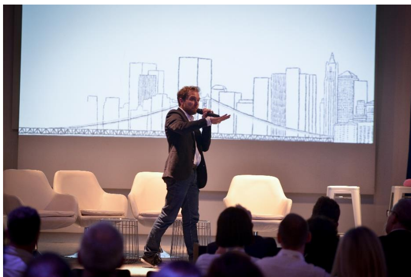
Assises Régionales des EDC (Entrepreneurs et Dirigeants Chrétiens), mai 2021, Palais des Congrès du Puy-en-Velay.